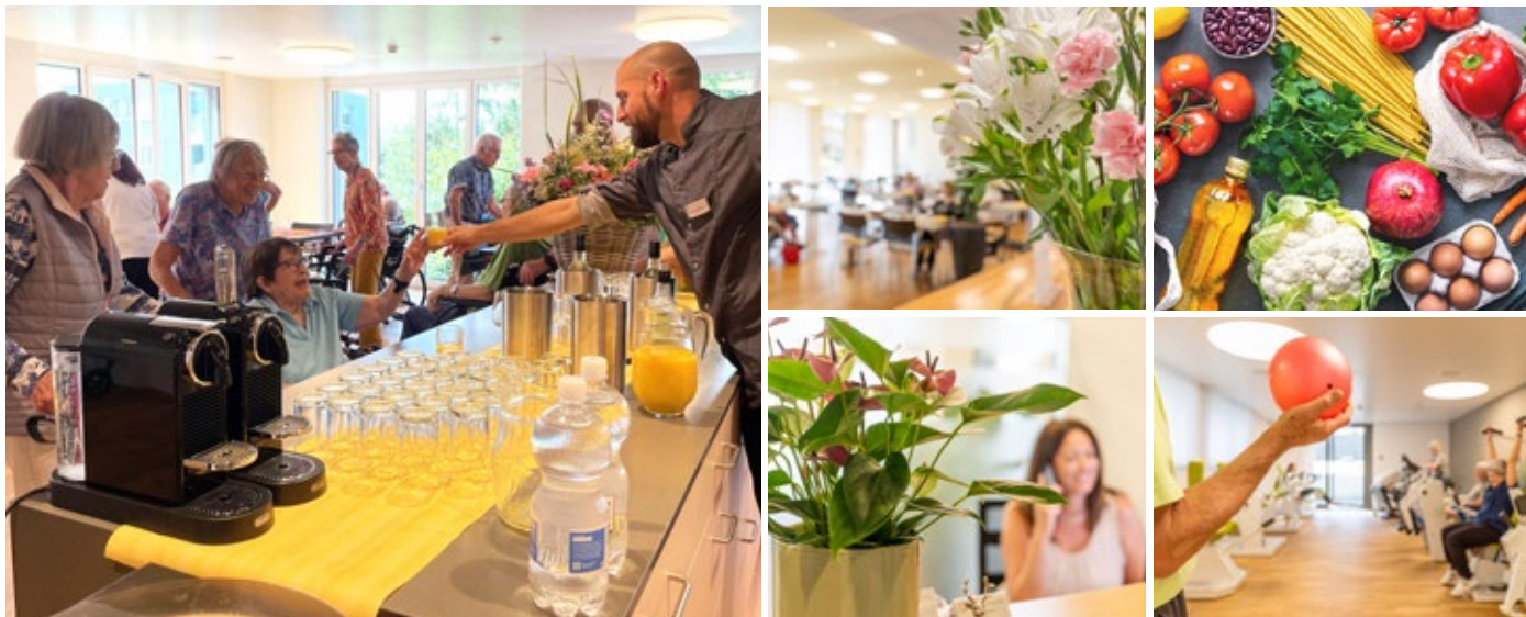
Speise- und Aufenthaltsräume, Empfang, Eingangsbereich und Restaurant erstrahlen in neuem Glanz

Was im August letzten Jahres begonnen hat, ist nun fast fertig: Der Umbau des 20-jährigen Grampen findet mit der Neugestaltung des Aufenthaltsraums im dritten Stock und des Eingangsbereichs sowie der Renovierung des Restaurants seinen Abschluss.