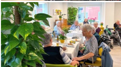
Stiftungsfest 2024: Zeit, gemeinsam zu feiern

Traditionell findet das Stiftungsfest im Juni an allen Standorten statt. Durch den Umbau im Grampen musste es dort verschoben werden, aber in allen anderen Standorten wurde fröhlich gefeiert.