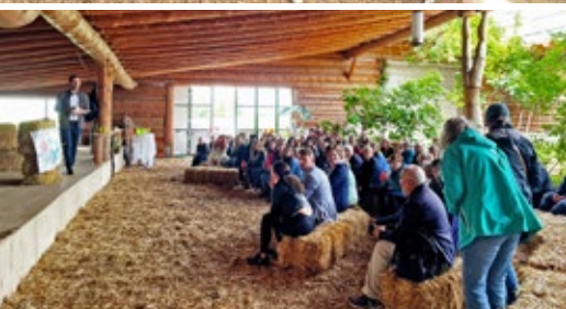
Die Mitarbeiter-Versammlung auf dem Hof Wiesengrund bleibt in schöner Erinnerung

Die Mitarbeiterversammlung auf dem Hof Wiesengrund war ein unvergessliches Erlebnis für die über 100 Mitarbeitenden, die mit dabei waren.